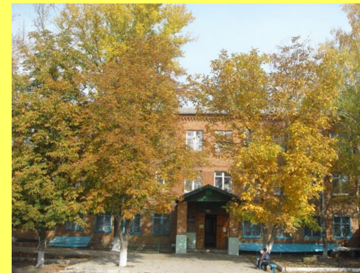
Буклет для родителей

ГУО «Вилейский районный социально-педагогический центр»